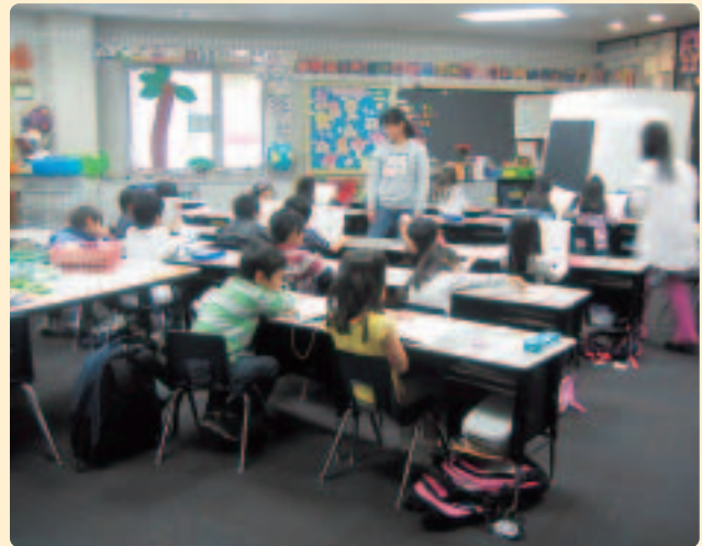
〈補習授業校の授業風景〉

※補習授業校…日本の教科書を使って国語、算数（数学）をはじめとする日本の教科を学習します。また、学習だけでなく、日本の学校習慣、生活習慣なども指導し、日本の学校文化に触れる機会をなるべく多く設けようと努力している学校も数多くあります。