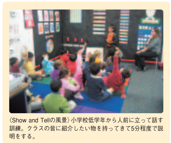
〈Show and Tellの風景〉小学校低学年から人前に立って話す訓練。クラスの皆に紹介したい物を持ってきて5分程度で説明をする。

英語での発言が十分にできるようになるまでの間、家庭では日本語でニュースやテレビ番組を見て感じたこと、思ったことを話させたり、社会情勢について親子で意見を交換するという練習をさせましょう。「考えをまとめ、述べる力」を養っておくことで、日本語ではもちろんのこと、英語力が身につけてきた折には英語でも考えを述べるのがよりスムーズにできるようになります。