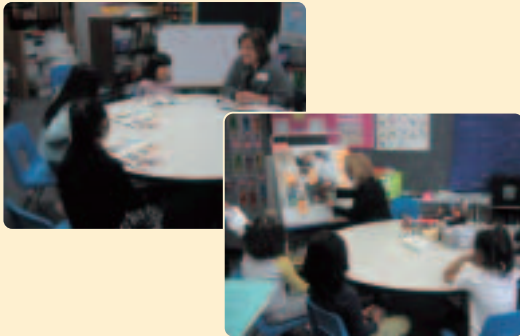
〈Pull-out式〉在籍するクラスの授業中に2~3人別室で集中的に英語を学習する。

※2 現地校入学用に「海外子女教育手帳」を販売しています。詳しくは裏表紙をご参照ください。