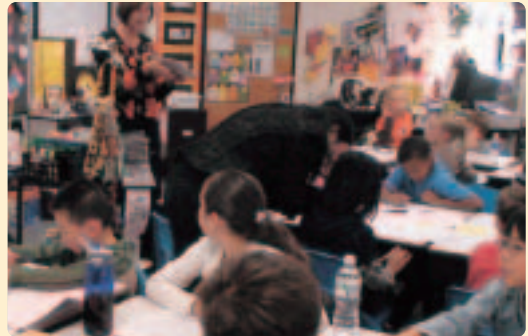
〈Push-in式〉在籍するクラスの中で授業を受けながら、必要に応じて何らかの言語サポートが提供される。